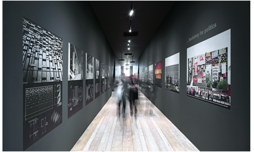
ETKİNLİK: Hafıza Mekânları