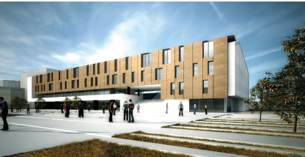
YARIŞMA: Kayseri Ticaret Odası Hizmet Binası Ulusal Mimari Fikir Yarışması