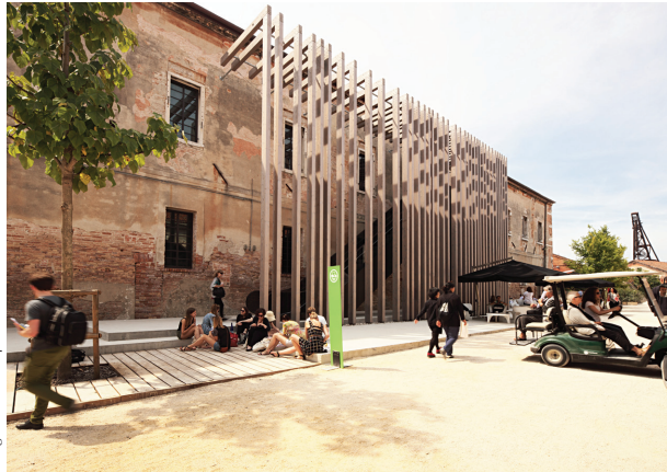
Türkiye Pavyonu'nun yer aldığı bina, Arsenale, 2014