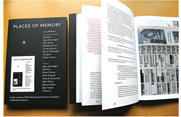
2014, Places of Memory / Hafıza Mekanları , Pelin Derviş (ed.), İKSV, İstanbul.

Yazının sonuna kişisel bir not iliştiirmek istiyorum: Bu bienalde Rem Koolhaas modernizmi, "Mimarlar değil Mimarlık" mottosuyla tartışmaya açarken Hafıza Mekanları, birey ile mimarlık / yapı çevre arasındaki ilişkiyi öne çıkararak bir anlamda mimarlığın büyük "M"sini de bir an için olsun kaldırmayı öneriyor. Gerçeklik belki de en çok burada aranabilir. ❖