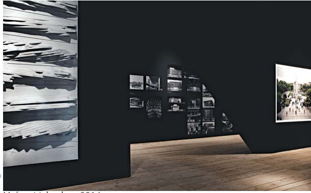
Hafıza Mekânları, 2014

Sağ kanatta ise Serkan Taycan'ın " Agoraphobia " ismini taşıyan işini görüyoruz. Taycan'ın çalışması kamusal alan olmanın yanı sıra birer toplumsal hafıza mekânı olan meydanlar üzerine. Proje hazırlık süre-