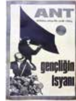
Afişlerde 1968 82.