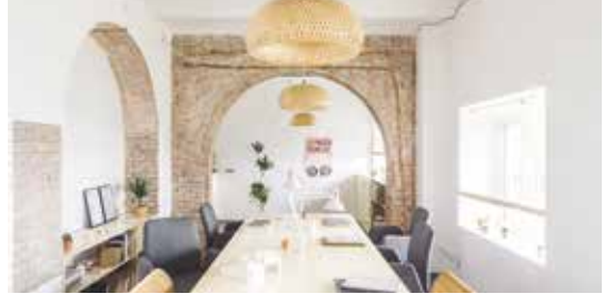
NUA architectures 44.