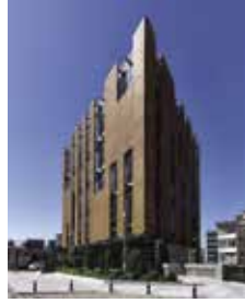
Cappadox 2018 102.